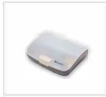
Ohrstöpsel-Box mit Ohrstöpseln