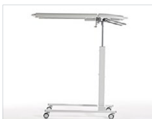
Design und Qualität made by GREINER