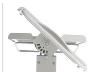
Ablage schwenkbar (BT plus)