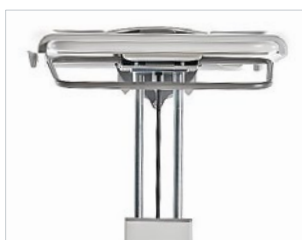
Höhenverstellung mit doppelter Führung

Funktionalität, Ergonomie, Stabilität und Hygiene sind bei den neuen Beistelltischen so durchdacht und hochwertig umgesetzt, dass sie höchsten Anforderungen von Patienten und Pflegepersonal gerecht werden. Der stabile Rahmen „made by GREINER“ und die leichtgängigen Laufrollen machen die Tische einerseits sehr beweglich, andererseits stehen sie für eine sichere Belastung von bis zu 30 Kilogramm. Leistungsfähige Gasdruckfedern erlauben den sanften Höhenhub des Tablett mit einer Hand – sicher auch im Notfall bei Trendelenburglagerung. Beim BT plus lässt sich das Tablett beidseitig mit leichtem Tastendruck aus der Waagrechten neigen, ergonomisch für Pfleger und Patient. Die Tablett sind abnehmbar mit Griffmulden, maßgerecht geformt für Speisetablett oder Patientenartikel sowie beim Pflegeelement für klinisches Zubehör und Desinfektionsmittel. Alle Oberflächen sind widerstandsfähig und besonders geeignet für zeitsparende Reinigung und Desinfektion. Diverse Zubehörelemente erweitern die Funktionalität um praktische Lösungen speziell für Patienten.