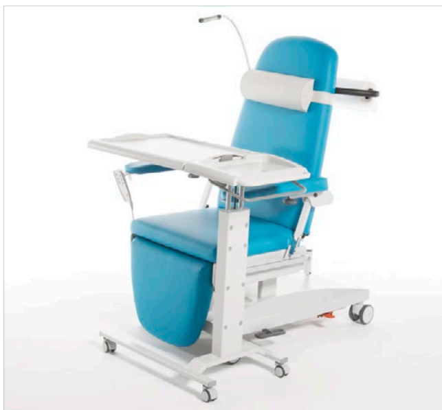
Ideale Kombination mit MULTILINE NEXT DC und IT (hier Modell IT)

Beistelltisch BT Stufenlos höhenverstellbar mit einer Hand, starres Tablett, Zubehör Haken und duales multifunktionales Staufach.