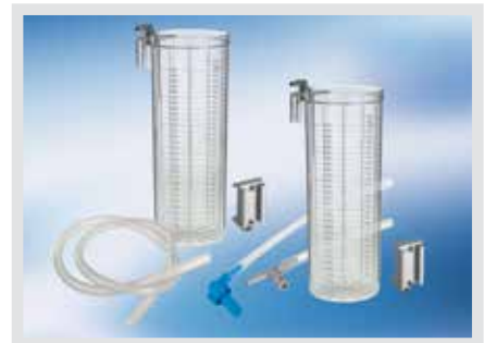
AS Chirurgieabsaugung: 2 x 3 l / Einweg / Serres (Art.-Nr. 5752 4940)