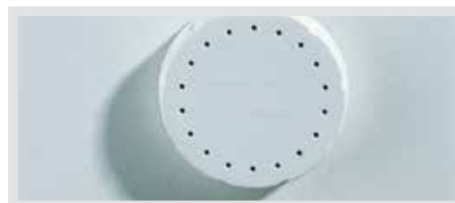
Bakterienfilter am Luftaustritt

Doppelter Kontaminationsschutz: Zusätzlich zum hydrophoben Bakterien- und Virenfilter für den Überlaufschutz, der sich am Eingang des Chirurgiesaugers befindet, verfügt die TWISTA SP 1070 über einen leistungsfähigen Bakterienfilter am Luftaustritt und damit über einen zweiten hochwirksamen Kontaminationsschutz. Die innovative Kombination beider Filtersysteme verhindert gerade in besonders kritischen Situationen, dass Bakterien und Viren in die OP-Luft gelangen. Dies garantiert ein Höchstmaß an Sicherheit für Patient und OP-Personal.