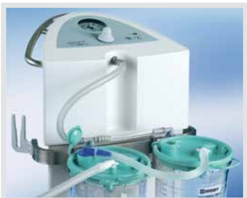
TWISTA SP 1070 Grundausrüstung: Einweg-Absaugbeutel mit integriertem hydrophobem Filter für Überlaufschutz

Drei Überlaufschutzvarianten für mehr Flexibilität: So individuell wie Anforderungen im OP sind, so flexibel ist das modulare Überlaufschutzsystem mit insgesamt drei Überlaufschutzvarianten.