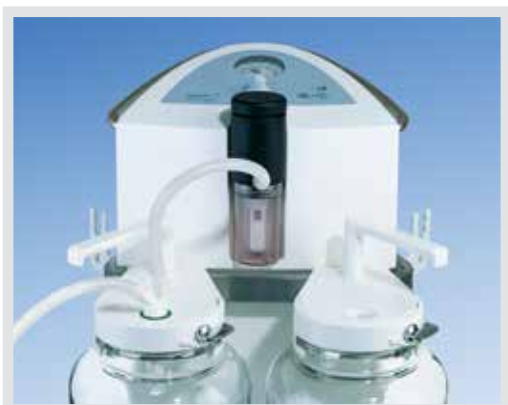
TWISTA SP 1070 mit mechanischem Überlaufschutz