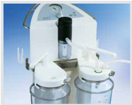
TWISTA SP 1070 mit zweifachem Überlaufschutz: Mechanischer Überlaufschutz und hydrophober Bakterien- und Virenfilter