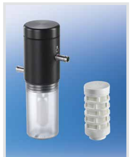
Überlaufschutzsystem mit hydrophobem Bakterien- und Virenfilter