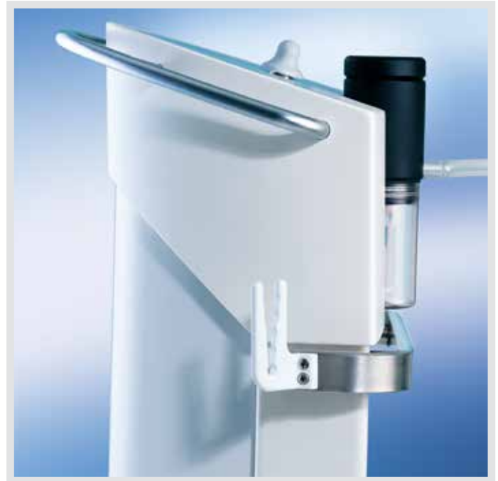
Die Seitenansicht zeigt den von allen Seiten erreichbaren Handgriff, den ergonomischen Saugstärkereglerschieber und die Geräteschiene mit Kabelhalter

Elektrische Sicherheit im Fokus: Damit die elektrische Energie nur dahin fließt, wohin sie soll, besitzt die TWISTA SP 1070 einen Anschluss für den Potentialausgleich – zum Schutz der Patienten vor elektrischer Überspannung. Dies ist zum Beispiel eine wichtige Voraussetzung für den Einsatz in der Herzchirurgie. Weiteres Zubehör wie Steckkrümmer aus Kunststoff erhöhen dabei den Schutz vor elektrischen Ableitungen.