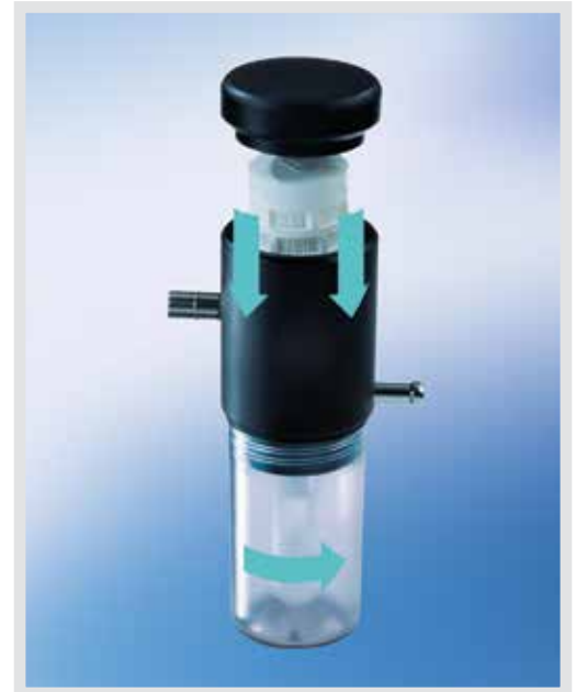
Überlaufschutzsystem mit mechanischem Überlaufschutz im unteren Teil und Kammer für hydrophoben Bakterien- und Virenfilter im oberen Teil des Überlaufschutzsystems

Alle Komponenten des Überlaufschutzes sind Bestandteil eines ökonomischen Mehrwegsystems und bei 134 °C autoklavierbar. Voraussetzung ist jedoch, dass der autoklavierbare hydrophobe Bakterien- und Virenfilter keine starken Verschmutzungen aufweist.