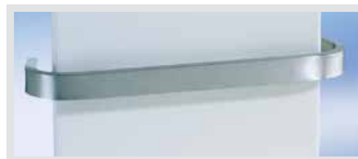
DIN-Geräteschiene zum Befestigen der Sekretbehälter

Integration leicht gemacht: Da die TWISTA SP 1070 mit genormten DIN-Geräteschienen an der Vorderseite ausgerüstet ist, können Mehrweg-Sekretbehältnisse wie auch Einwegsysteme verschiedenster Hersteller mit unterschiedlichem Fassungsvermögen und in unterschiedlicher Ausführung schnell und sicher angebracht bzw. ausgewechselt werden – und das mit wenigen Handgriffen.