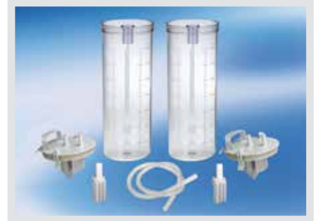
AS Chirurgieabsaugung: 2 x 4 l PSU / Mehrweg (Art.-Nr. 5752 5664)