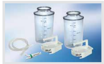
AS Chirurgieabsaugung: 2 x 3 l / Mehrweg (Art.-Nr. 5752 2068)