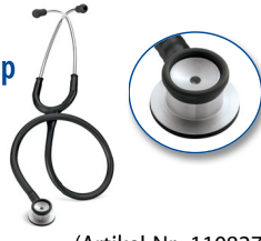
(Artikel-Nr.: 110827) Schlauchfarbe: SW RO KB