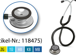
(Artikel-Nr.: 118475) Schlauchfarbe: SW GR BU PF LA PM ZG TU HB KB MB