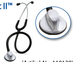
(Artikel-Nr.: 110128) Schlauchfarbe: SW