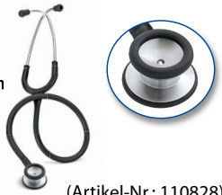
(Artikel-Nr.: 110828) Schlauchfarbe: RO HR KB